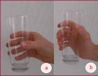
Abb. 4a, b Vergleich: Greifen ohne (a) und mit aktiviertem Handgewölbe (b)

sam mit der Therapeutin kann der Klient festlegen, dass er beispielsweise immer bei einer bestimmten Yogaübung mit aktivem Handgewölbe stützt. Oder dass er sein Handgewölbe beim täglichen Griff zum Shampoo aktiviert. Das beschriebene Vorgehen ist beispielhaft. Die Spiraldynamik® ist bei der Therapie eher als übergeordnetes Prinzip zu verstehen als eine Sammlung von Übungen in vorgege-