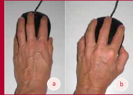
Abb. 6a, b Vergleich: Dyskoordinierter (a) und koordinierter (b) Gebrauch der Mouse

der Daumenseite) gebraucht, erschaffen die Bandstrukturen und lassen das Handgewölbe immer flacher werden. Alternativ kann es sich auch verschmälern durch einen übermäßigen Einsatz der Finger, vor allem des Daumens (Abb. 4). Der Gebrauch der Finger ohne die Unterstützung des Handgewölbes führt zu einer immer schwächer werdenden Binnenhandmuskulatur bzw. einer vermehrten einseitigen Belastung der Daumenseite. Der Karpaltunnel verliert dabei zunehmend seine ursprüngliche Bogenform, und es kommt zu einem Missverhältnis zwischen dem immer enger werdenden Kanal und dem innenliegenden Volumen. Gefäße verengen sich, Nerven werden gequetscht. Es treten Sensibilitätsstörungen, Kraftverlust und Schmerzen auf. Eine Operation, bei der das Retinaculum flexorum zum Teil oder ganz durchtrennt wird, kann helfen, Symptome zu reduzieren, ersetzt jedoch nicht den ursprünglichen Gewölbebogen.