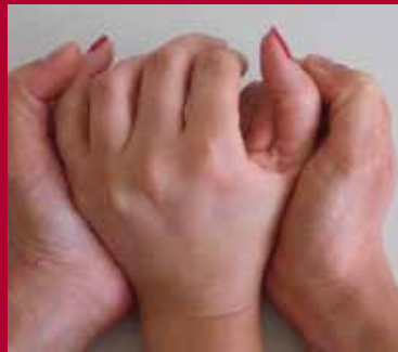
Abb. 5 Assistive Bewegungsführung