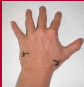
Abb. 3 Gewölbeprinzip Hand

Archaische Bewegungen wie das Gehen oder die Atmung verlaufen in einem rhythmischen Wechsel. Dabei ver- oder entschraubt sich das dazwischenliegende Volumen im Sinne einer Wellenbewegung, dem sogenannten Wellenprinzip. Auch die Hand als kugelige Gewölbestruktur folgt beim Greifen einer Wellenbewegung. Beim Zufassen baut sich das Handgewölbe auf, beim Loslassen flacht es sich wieder ab.